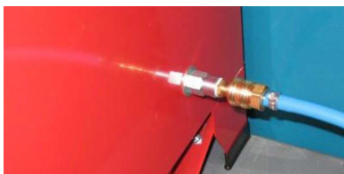
Abb. 6: Připojení vedení stlačeného vzduchu

Vlhký stlačený vzduch negativně ovlivňuje průtok abraziva a může vést k ucpání ventilů a vedení.