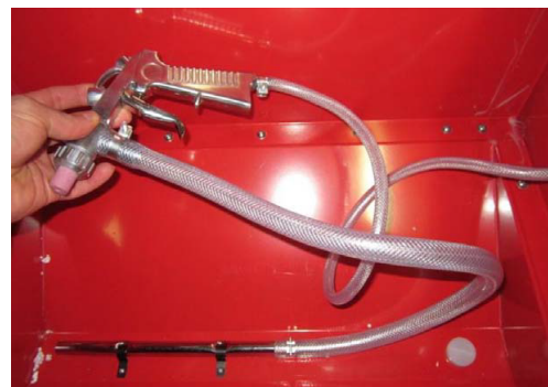
Abb. 5: Montáž vedení

Krok 3: Zkontrolujte pevné dotažení všech šroubů a matic.