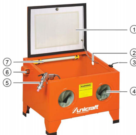
Abb. 3: Pískovací box SSK 1

Vyobrazení se může od skutečnosti lišit.