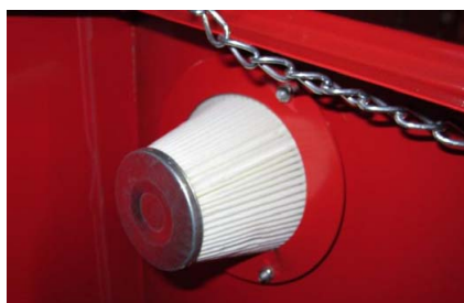
Abb. 4: Montáž filtru

Krok 1: Otevřete víko boxu a našroubujte přiložený filtr na odvětrávací otvor vpravo nahoře (Obr. 4).